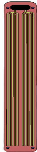
Capteur pour déterminer le niveau d'eau